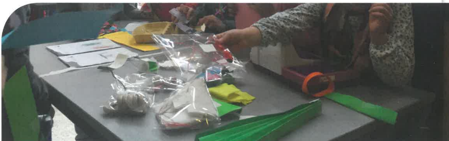
Kopen en verkopen in de sieraden winkel.