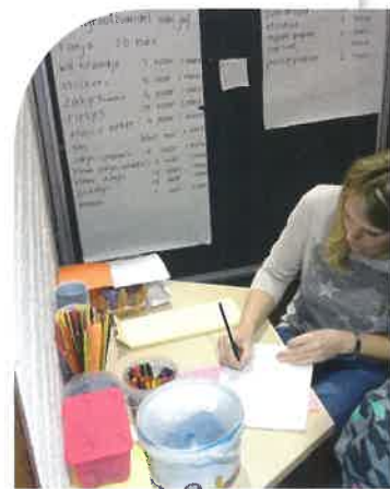
De juf in de groothandel.